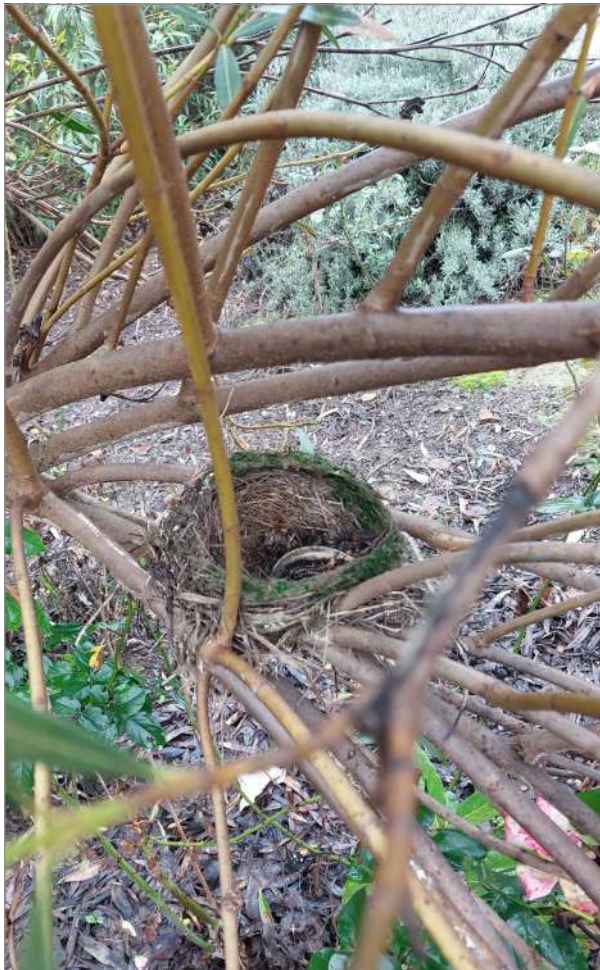
Nido EDAR de Montilla.