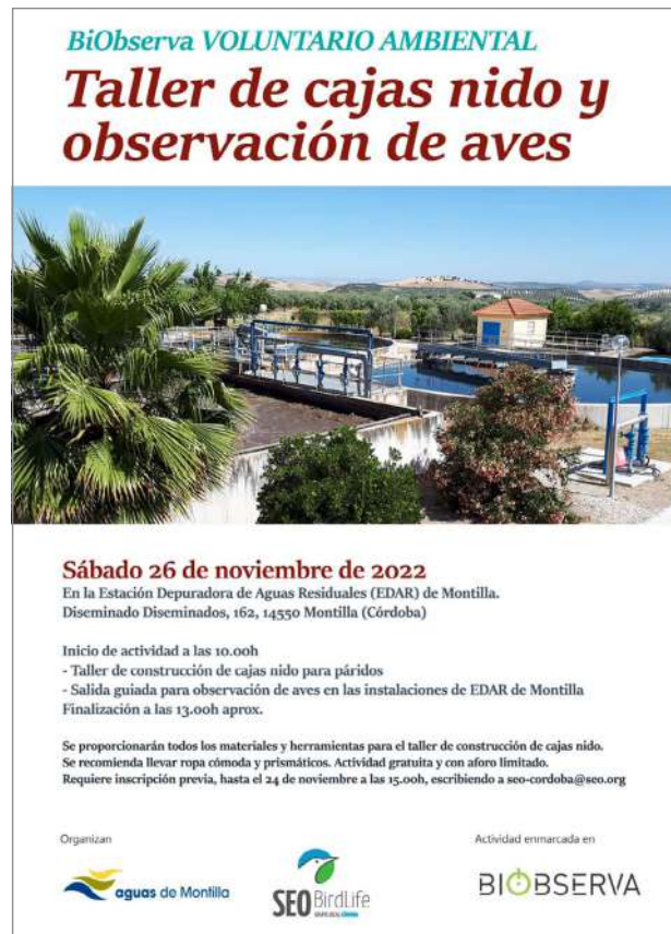
Taller cajas nido.