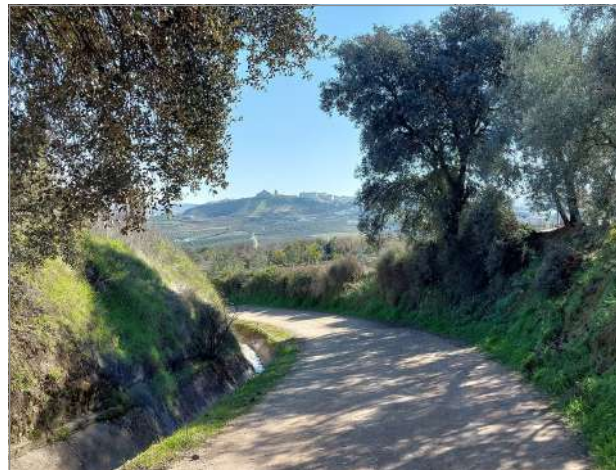
Entorno natural de Montilla.